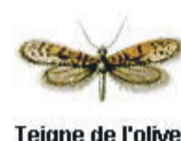
Teigne de l'olive