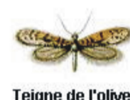
Teigne de l'olive