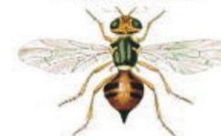
Mouche de l'olive